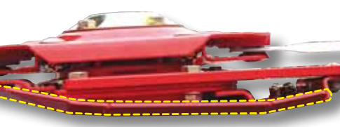
Integrovaná ochrana proti kamenům