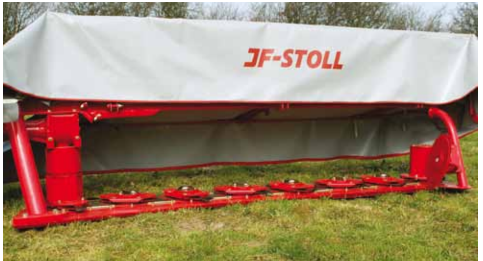
Nízká žací lišta