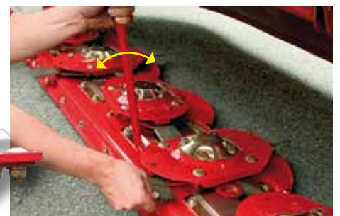
Quick'n Safe - pro snadnou a rychlou výměnu nožů